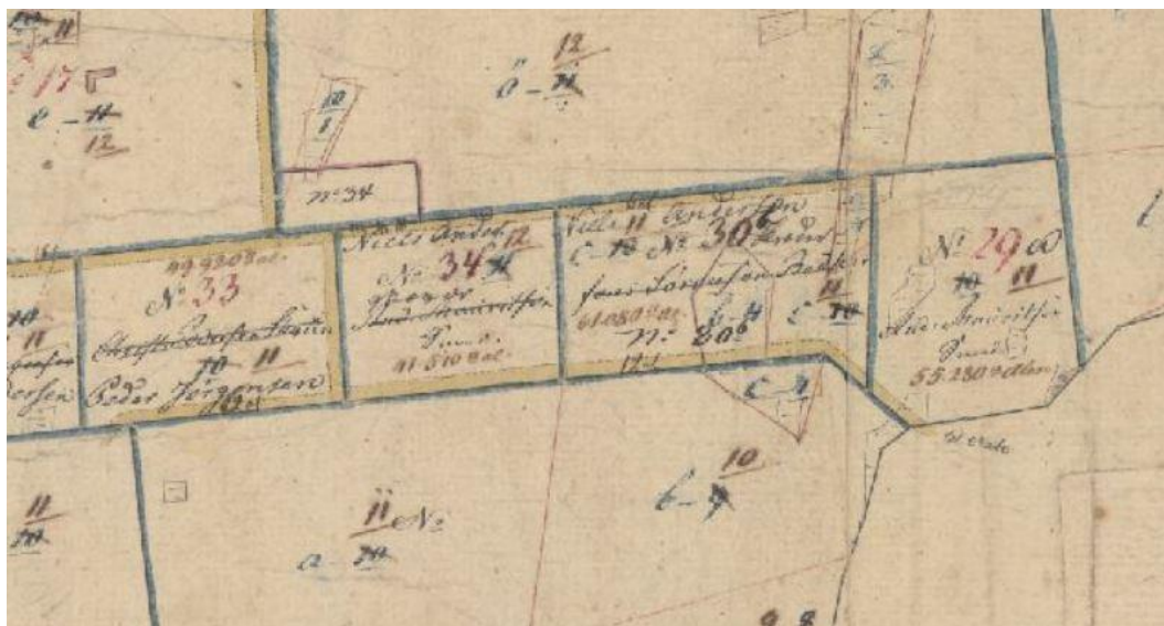
Historiske kort 1815 - 1864