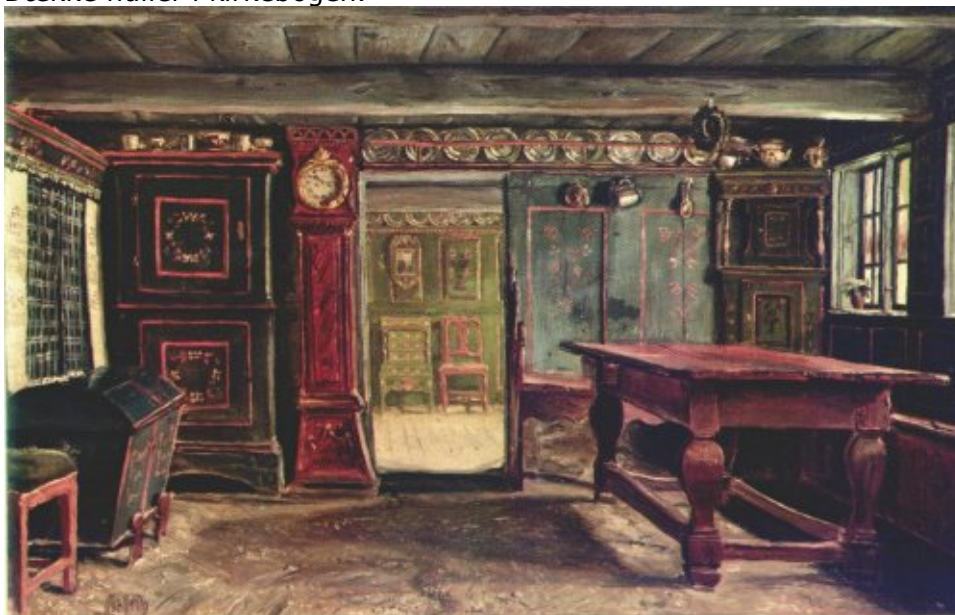
Christen Dalsgaard: Bondestue fra Sjælland 1847 (tidligere kaldet Bondestue i Salling). 95,5 × 41,5 cm. Den Hirschsprungske Samling.

Kød på slægtshistorien – formidling – hvem er målgruppen. Dække huller i kirkebogen.